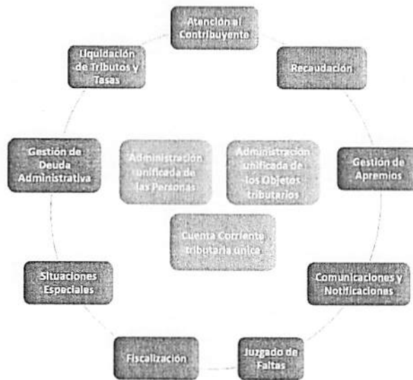
Ilustración 1.- Características del sistema

Brinda herramientas para sistematizar y optimizar la recaudación de impuestos relacionados a catastro y predio. Inteligencia Artificial y de procesamiento de imágenes para detectar de forma automática los cambios realizados a los predios y calcular el impuesto actualizado.